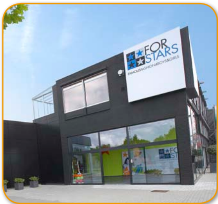
Een moderne gevel met grote glaspartijen

Het gebouw is een voormalige garage die omgebouwd werd door Bossuyt Winkelinrichting. Het pand heeft een totale grondoppervlak van 1.475 m 2 , waarvan 1.000 m 2 verkoopsruimte. Aan de buitenzijde werd gekozen om de gevel hoger op te trekken met panelen om meer op te vallen in het straatbeeld. Het geheel ziet er uit als een zwarte doos; met binnenin "geheimen" die de klanten komen ontdekken. Er werd bewust gekozen voor weinig etalages, omdat de klant echt naar de winkel komt om er binnen te gaan: het ligt buiten het centrum en er zijn geen andere commerciële panden in de omgeving.