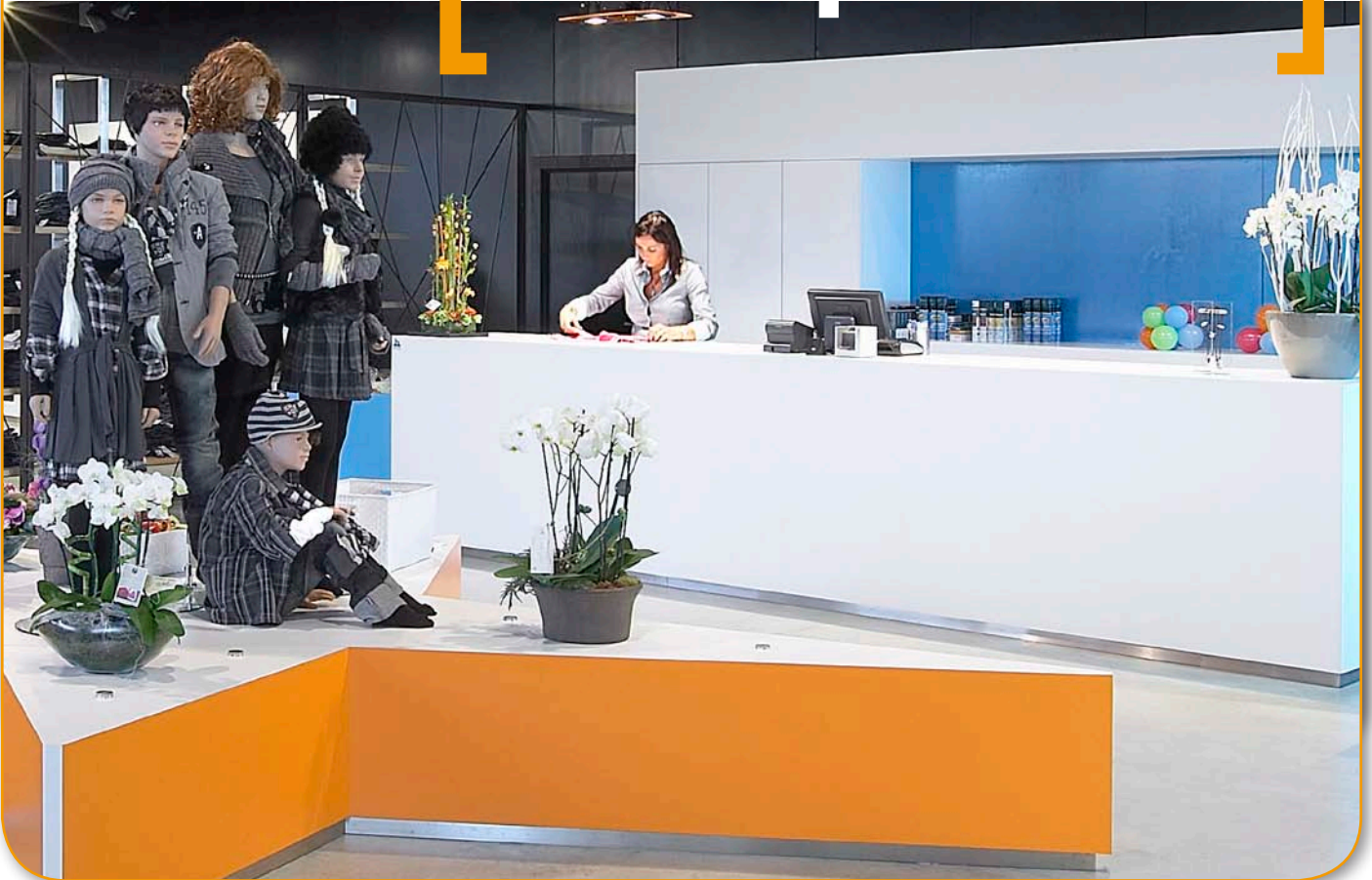
Een presentatie-eiland als eyecatcher