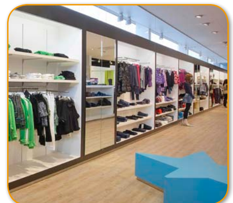
Een overzichtelijke, trendy winkel

bediening toe te laten. Jongens en meisjes hebben ook elk een aparte schoenenafdeling. Deze zones zijn ook uniek in het concept: het is een shop-in-the-shop; om dit aan de klanten duidelijk te maken is er gekozen voor een andere vloerbedekking: tapijt. De flexibele meubelopstelling en de accentwand met led-stroken zorgen voor een open ruimtegevoel. De zwevende legbanken die opgehangen zijn aan spankabels benadrukken het open en moderne gevoel. Een extra uniek element is dat de schoenen volledig zelfbediening zijn, zodat de kinderen op hun gemak kunnen kiezen. De administratie-afdeling en de kassazone liggen vlak naast elkaar, maar zijn van elkaar gescheiden via een one-way-view screen.