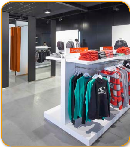
Gebruik van “stoere” materialen zoals gepolierd beton